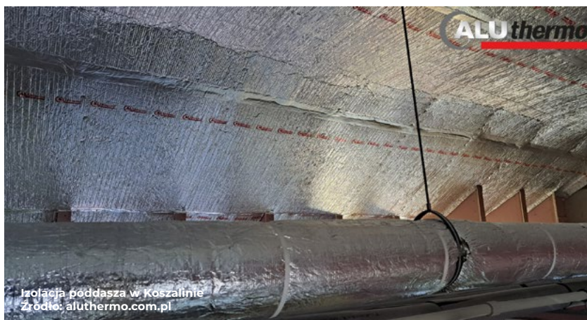
Izolacja poddasza w Koszalinie

Aluthermo® QUATTRO to produkt, który umożliwia maksymalne docieplenie pomieszczeń przy minimalnym zagospodarowaniu przestrzeni , co sprawia, że jest idealnym rozwiązaniem nawet dla najbardziej wymagających projektów budowlanych.