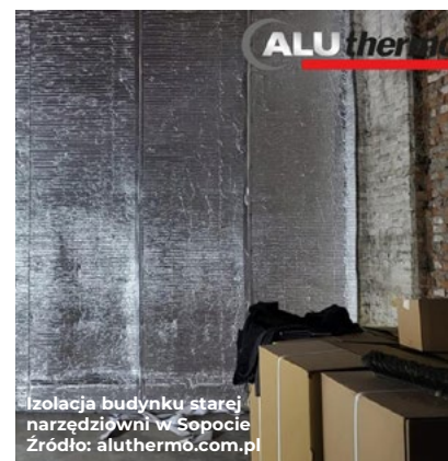
Izolacja budynku starej narzędziowni w Sopocie

Ponadto, Aluthermo® QUATTRO jest idealnym rozwiązaniem dla domków modułowych, mobilnych struktur oraz hal namiotowych , gdzie konwencjonalne metody izolacji mogą być niewystarczające lub trudne do zastosowania. Jego elastyczność i wysoka skuteczność termiczna sprawiają, że jest niezastąpiony w warunkach wymagających szybkiego i skutecznego ocieplenia.