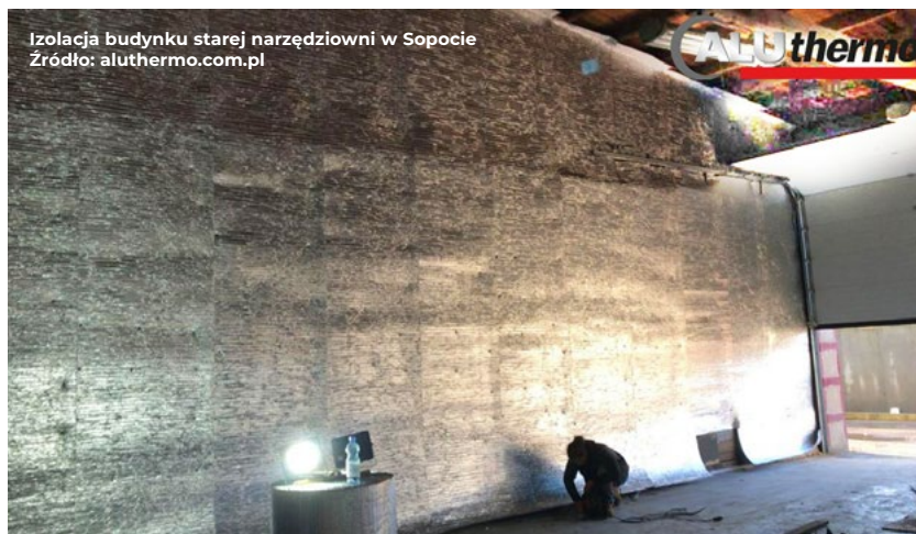
Izolacja budynku starej narzędziowni w Sopocie

Izolowanie podkrokwiowe ma na celu poprawę ogólnej efektywności termicznej budynku poprzez równomierny montaż izolacji na całej powierzchni poddasza. Co więcej, dzięki stosowaniu izolacji pod-