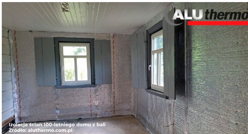
Izolacja ścian 100-letniego domu z bali